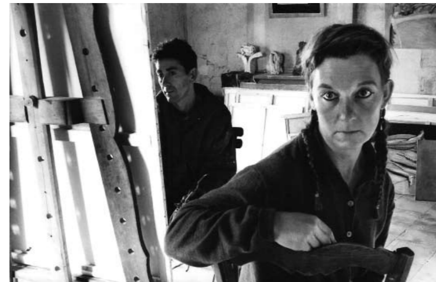
Мастерская в Ласоне, июнь 1997

– Для каждой эпохи есть свое совершенство согласно стандартам представления, которые она для себя определяет. И, без сомнения, желательно переступить через эти стандарты. В наше время уже не осталось ничего, через что еще можно переступить, кроме моральных кодексов. Но это уже не из области искусства. Для меня совершенство – это фотография со своими границами, которые переступает только эмоциональность. Другими слова-