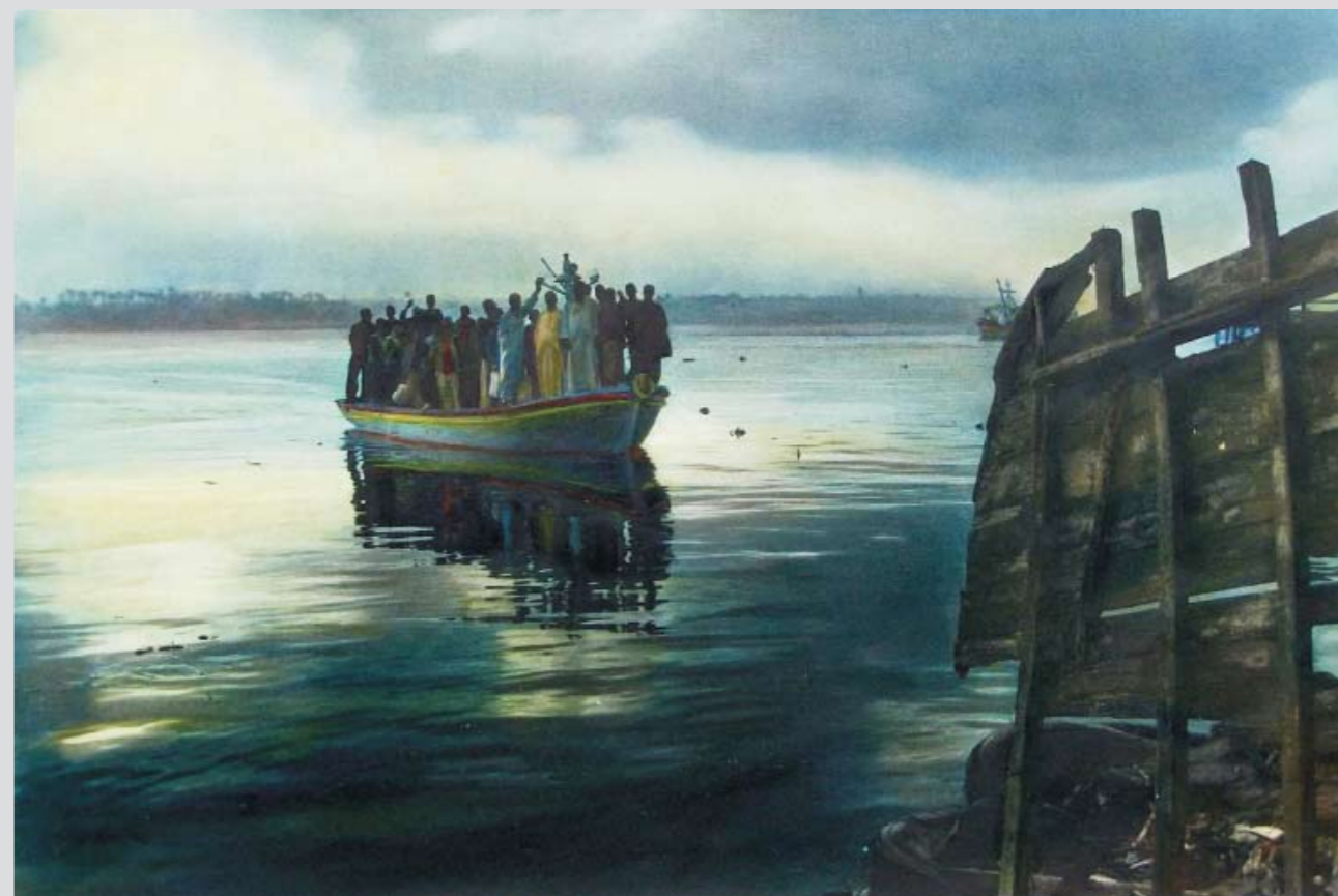
Переход через Нил – Рашид, 1998