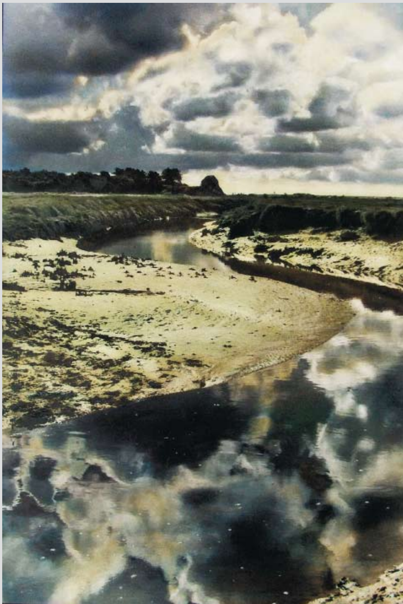
Гавань на Сен Жермен сюр Ай

епархию патриархатом. – Прим. ред.). Вероятно, это обычная ситуация армянского мигранта, однако она прямо отвечает на ваш вопрос, подчеркивая мою религиозную нейтральность.