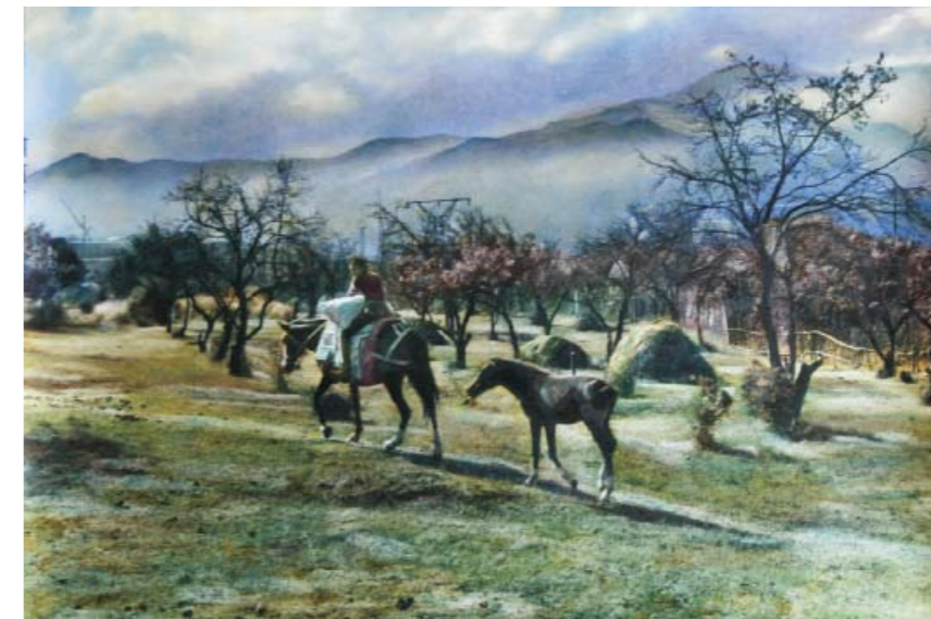
Плоскогорье Лалвар, Армения

– Очевидно, что философы всегда больше интересовались визуальными искусствами, в частности, живописью, чем другими видами искусства, например, музыкой, которая отвечает естественной потребности и является прежде всего искусством развлекательным. А визуальные виды искусства во всех своих абстракциях несут миру суждения об образе бытия. Исходя из этого, я считаю правильным, чтобы создатели визуального искусства отвечали на абстрактные вопросы философов. Изображение – это неожиданное вторжение в интерпретированную людьми реальность, которое следует доказывать и подтверждать.