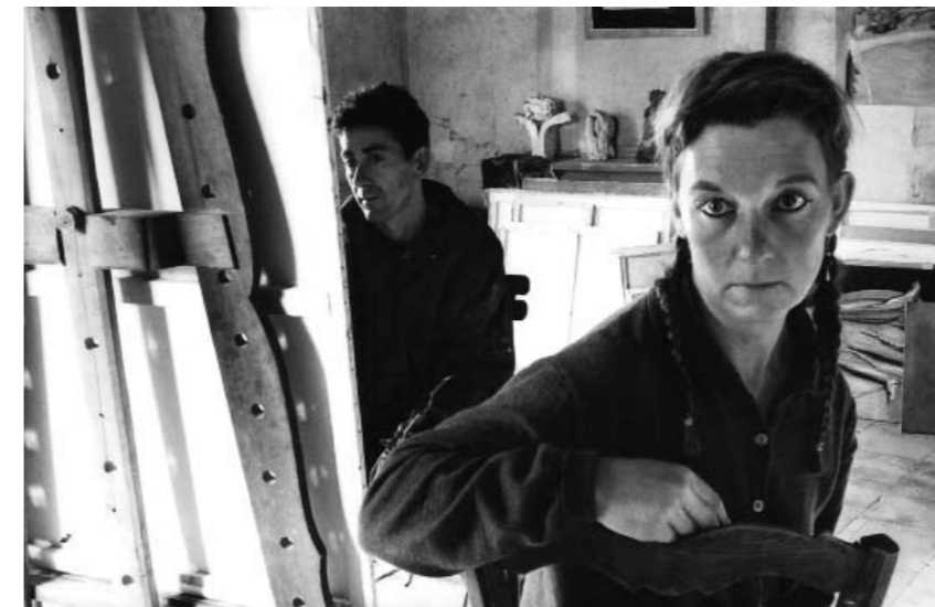
Мастерская в Ласоне, июнь 1997