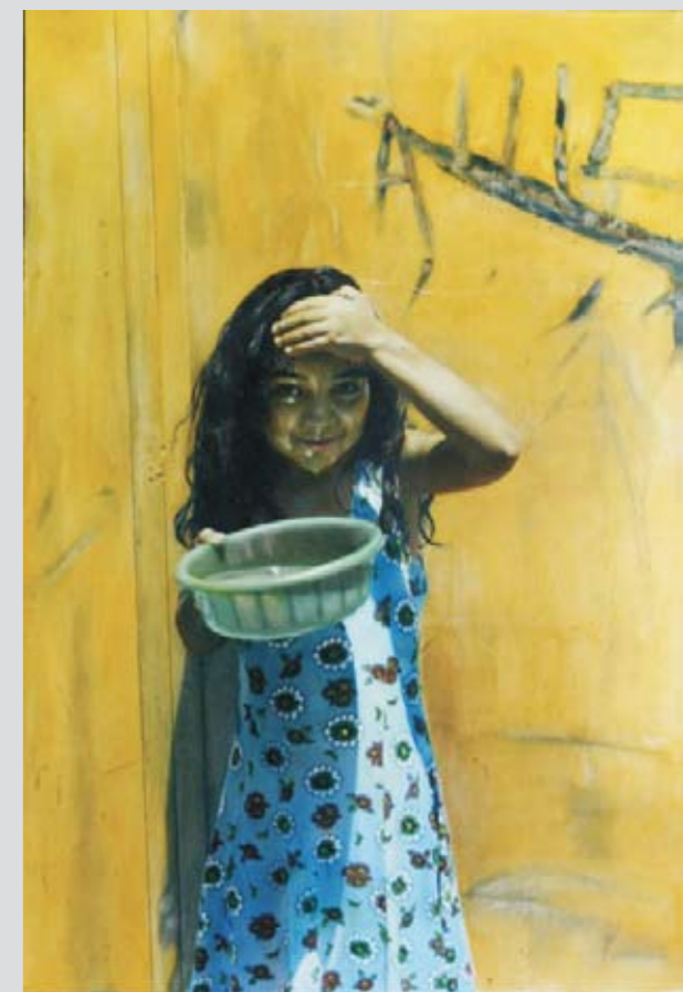
Улица Тпагринчери, Ереван