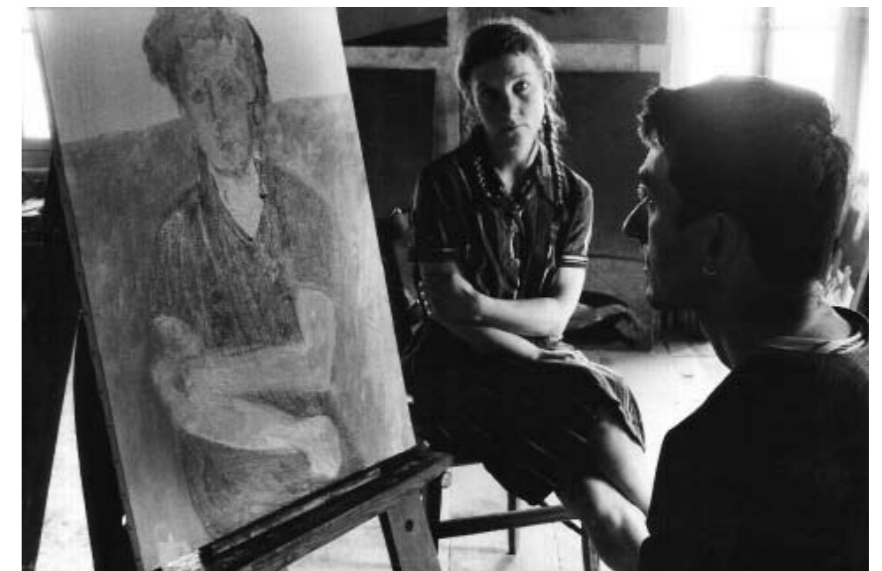
Мастерская в Ласоне, апрель 1996, фото Кати Бояджян

– Для каждой эпохи есть свое совершенство согласно стандартам представления, которые она для себя определяет. И, без сомнения, желательно переступить через эти стандарты. В наше время уже не осталось ничего, через что еще можно переступить, кроме моральных кодексов. Но это уже не из области искусства. Для меня совершенство – это фотография со своими границами, которые переступает только эмоциональность. Другими слова-