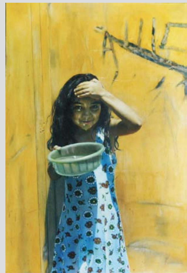
Улица Тпагртчнери, Ереван